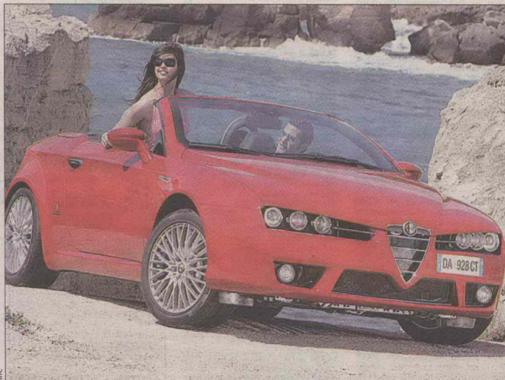
Alfa Romeo Spider.

Jeszcze nigdy na targach organizowanych w Katowicach nie było tylu premier, nie mówiąc już o samochodach tej klasy co Lamborghini. Nigdy też organizowane na naszym terenie targi nie miały tak bardzo charakteru wielkiego motoryzacyjnego show, zabawy z samochodami w tle. Nigdy nie było aż takiej ilości imprez towarzyszących.