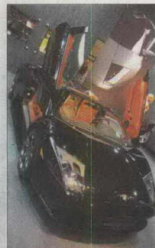
Odbyła się też pierwsza w Polsce prezentacja Lamborghini.

Tak pomyślana impreza zakończyła się świetnym wynikiem