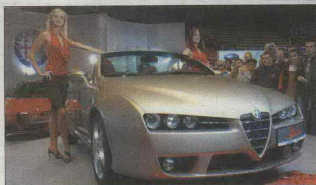
Przedstawiono prawie wszystkie nowości.